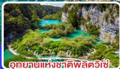
อุทยานแห่งชาติพลิทวิเซ่