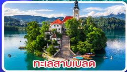
ทะเลสาบเบลด

ไข่มุกแห่งอาเดรียติก พร้อมขึ้นกระเช้า SRD