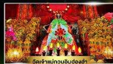
วัดเจ้าแม่กวณัฒมอองอำ