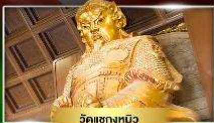
วัดเขกขงหนิว

ชมกันถึงหันนำโชควัดเขกขง ยี่มาเว้ "เจ้ากวณัฒมอองอำ"