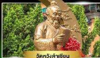
วัดหวังตำเซียน