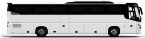
ตัวอย่างรถทัวร์ 1 ชั้น

หากประเภทห้องที่ท่านริเคอสมามีเต็มจาก เช่น ริเคอสห้องพักเป็น TWIN BED หรือ DOUBLE BED ทางบริษัทขอสงวนสิทธิ์ในการปรับประเภทห้องพัก เป็นตามที่โรงแรมมีอยู่ โดยไม่ต้องแจ้งให้ทราบล่วงหน้า