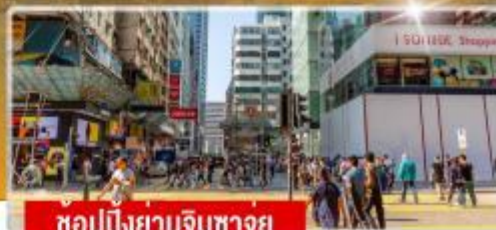
ชอปปิงยานจิมซาจุย