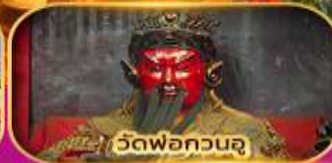
วัดพ่อกวนจู