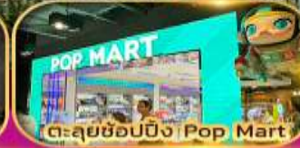
ตะลุยช้อปปิ้ง Pop Mart