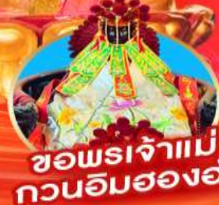
ขอพรเจ้าแม่ กวนอิมฮ่องกง