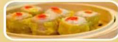
ต้มซ่าฮ่องกง