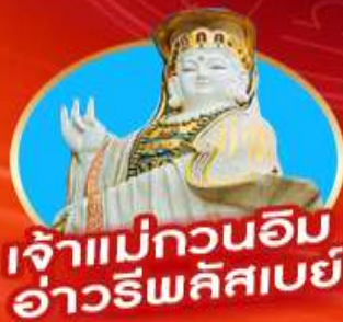
เจ้าแม่กวนอิม อ่าวรีพลัสเบย์