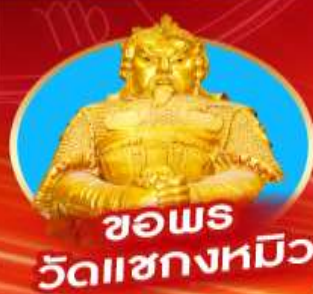
ขอพร วัดเขากงหมิว