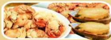
พิเศษ! มื้อหลิว่มุน