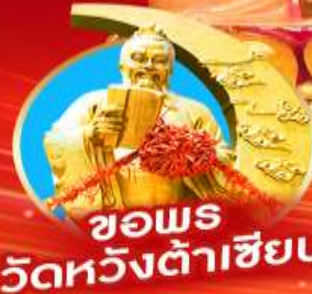
ขอพร วัดหวังต้าเซียน