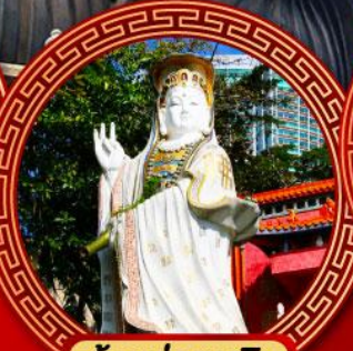
เจ้าแม่กวนอิม ริพัลส์เบย์