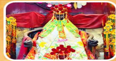
วัดเจ้าแม่กวนอิมสองอำ