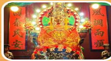
วัดเจ้าแม่กวนอิมเทียนหัว