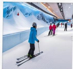
บ้านหิมะ WINDOW OF THE WORLD