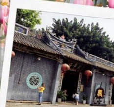
วัดกวนอูเซินเจิ้น