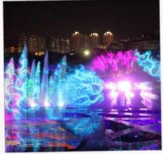
โชว์น้ำสามมิติ OCT BAY WATER SHOW