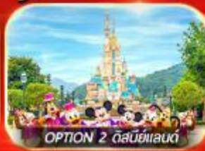
OPTION 2 ดิสนีย์แลนด์

เต็มอิ่ม ทั้งไหว้พระ-ขอพร การเงิน การงานความรักและซ่อมปัง