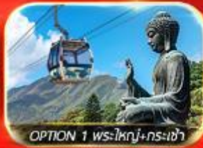
OPTION 1 พระใหญ่+กรงเจ้า