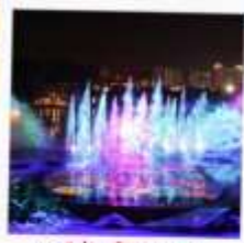
โชว์น้ำสามมิติ OCT BAY WATER SHOW