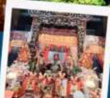
เทพเจ้ากวนอู วัดกวนไท