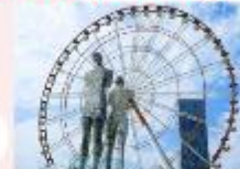
รูปปั้นอาลีและนีโน