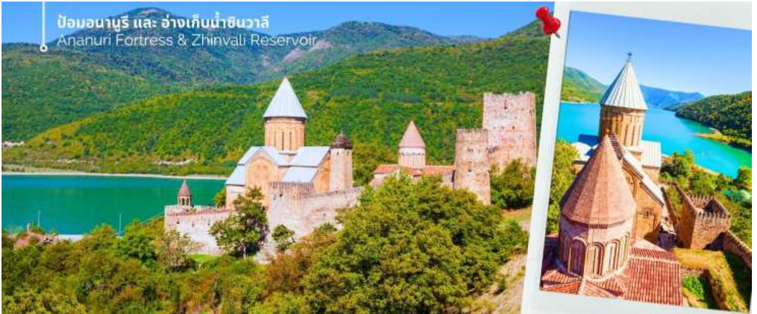
ป้อมอนานูรี และ อ่างเก็บน้ำชินวาลี Ananuri Fortress & Zhinvali Reservoir

ออกเดินทางต่อไปยังเมืองกอรี (ใช้เวลาเดินทางประมาณ 1 ชั่วโมง 20 นาที) นำท่านเที่ยวชม พิพิธภัณฑ์โจเซฟ สตาลิน (Stalin Museum) ซึ่งที่เมืองนี้เป็นบ้านเกิดของโจเซฟ สตาลิน อดีตผู้นำสูงสุดของสหภาพโซเวียต สตาลินถูกยกย่องเป็นวีรบุรุษที่นำพาสหภาพโซเวียตให้รุ่งเรือง แต่ในขณะเดียวกันก็เป็นที่รู้จักในด้านการกดขี่ข่มเหงและการฆ่าล้างเผ่าพันธุ์ พิพิธภัณฑ์แห่งนี้จึงเป็นแหล่งเรียนรู้เกี่ยวกับชีวิตและผลงานของสตาลิน รวมถึงผลกระทบที่เขามีต่อ