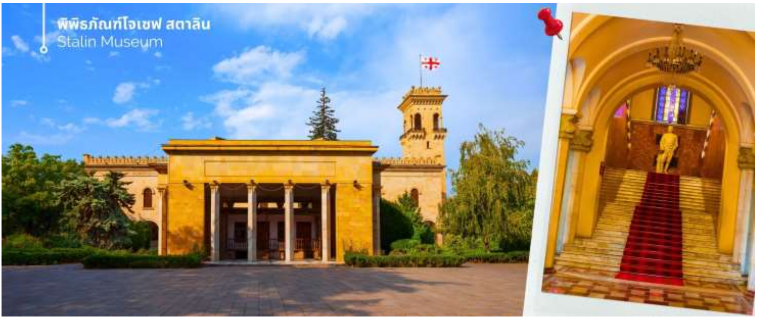
พิพิธภัณฑ์โจเซฟ สตาลิน Stalin Museum

ออกเดินทางต่อไปยังเมืองกอรี (ใช้เวลาเดินทางประมาณ 1 ชั่วโมง 20 นาที) นำท่านเที่ยวชม พิพิธภัณฑ์โจเซฟ สตาลิน (Stalin Museum) ซึ่งที่เมืองนี้เป็นบ้านเกิดของโจเซฟ สตาลิน อดีตผู้นำสูงสุดของสหภาพโซเวียต สตาลินถูกยกย่องเป็นวีรบุรุษที่นำพาสหภาพโซเวียตให้รุ่งเรือง แต่ในขณะเดียวกันก็เป็นที่รู้จักในด้านการกดขี่ข่มเหงและการฆ่าล้างเผ่าพันธุ์ พิพิธภัณฑ์แห่งนี้จึงเป็นแหล่งเรียนรู้เกี่ยวกับชีวิตและผลงานของสตาลิน รวมถึงผลกระทบที่เขามีต่อ