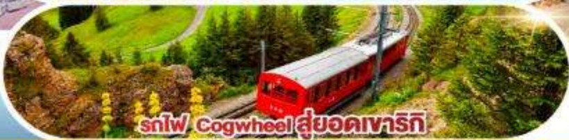
รถไฟ Cogwheel สู้ออดเวจาร์ก