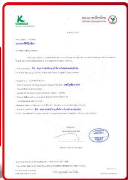
ตัวอย่าง Bank Guarantee ที่ผู้สมัครต้องขอกับธนาคาร