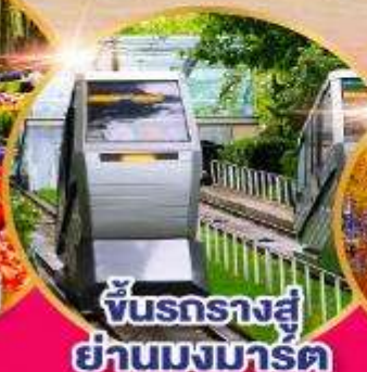
ชั้นรางสู่ ย่านมกราคม