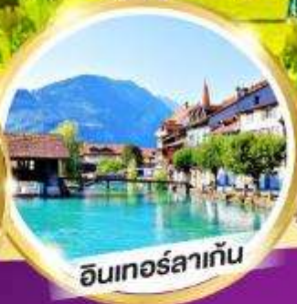
อ็อนเทอร์ลากัน