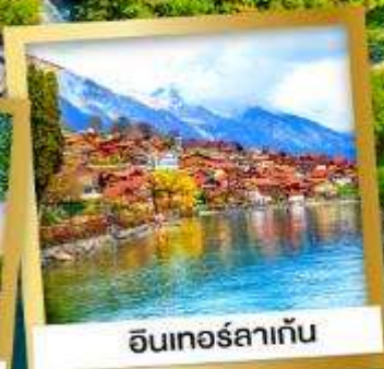
อินเทอร์ลาเก้น