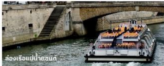
ล่องเรือแม่น้ำแซน

จากนั้นนำท่าน ล่องเรือบาโตมุช (Bateaux Mouches River Cruise) เรือล่องไปตามแม่น้ำแซน ที่ไหลผ่านใจกลางกรุงปารีส ชมความสวยงามของสถาปัตยกรรมอันคลาสสิกของอาคารต่างๆ