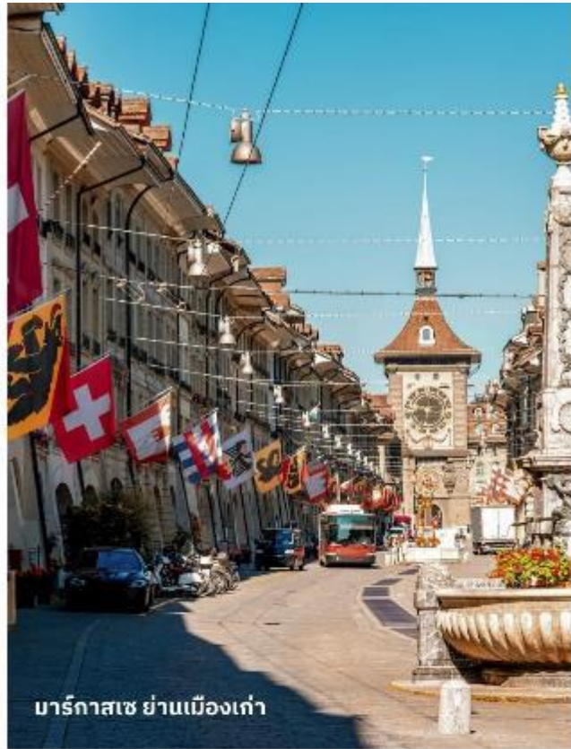
มาร์กาสเซ ย่านเมืองเก่า

ปัจจุบันเต็มไปด้วยร้านดอกไม้และบูติก เป็นย่านที่ปลอดภัยจนดี จึงเหมาะกับการ เดินเที่ยวชมอาคารเก่า อายุ 200-300 ปี