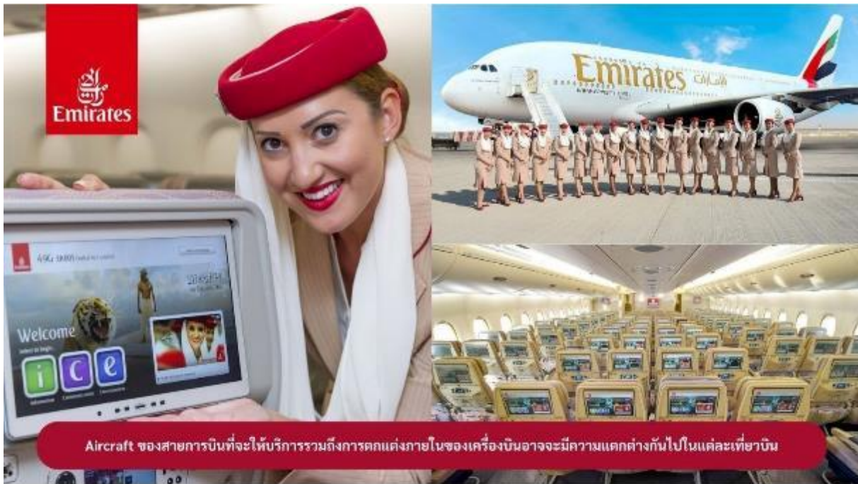
Aircraft ของสายการบินที่จะให้บริการรวมถึงการตกแต่งภายในของเครื่องบินอาจมีความแตกต่างกันไปในแต่ละเที่ยวบิน