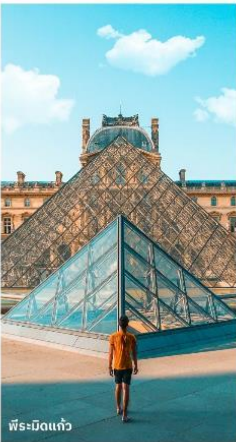
พีระมิดแก้ว

เดินทางสู่ พิพิธภัณฑ์ลูฟร์ ให้ท่านได้ถ่ายรูปด้านหน้า พีระมิดแก้วของพิพิธภัณฑ์ลูฟร์ เป็นพิพิธภัณฑ์ทางศิลปะที่มีชื่อเสียงที่สุด เก้าแก่ที่สุดและใหญ่ที่สุดแห่งหนึ่งของโลก