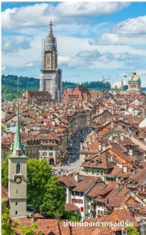
ย่านเมืองเก่ากรุงเบิร์น

นำท่านลัดเลาะชม ถนนจุงเคอร์นกาสเซ ถนนที่มีระดับสูงสุดของเมืองนี้ ซึ่งเต็มไปด้วยร้าน ภาพวาดและร้านขายของเก่าในอาคารโบราณ