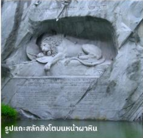
รูปแกะสลักสิงโตบนหน้าผาหิน