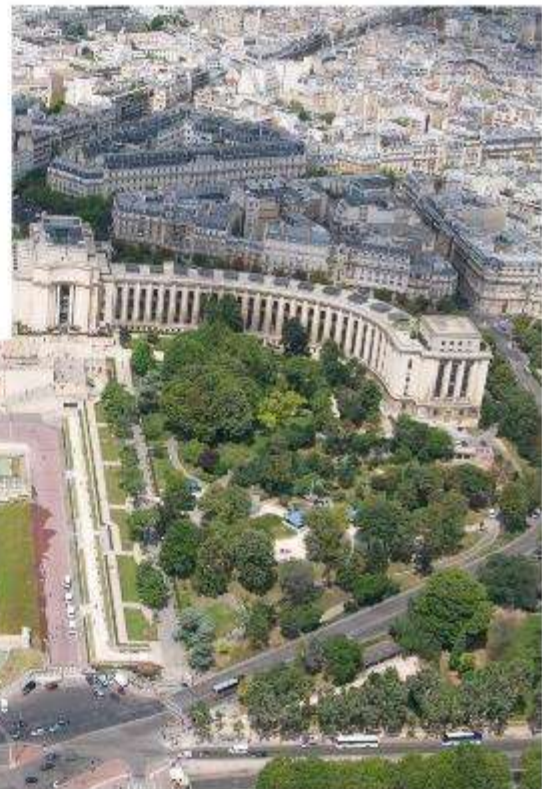
มุมมองเมืองปารีสจากหอไอเฟล