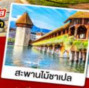
สะพานไม้อาเปลา

18-26 ก.ย. 67 09-17, 12-20 ต.ค. 67 30 พ.ย.-08 ธ.ค. / 08-16 ธ.ค. 67 28 ธ.ค. 67-05 ม.ค. 68 (ปีใหม่)