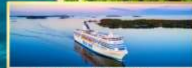
เรือ Tallink Silja Line