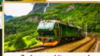
รถไฟสายฟลิมสบาน่า