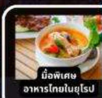
มือพิเศษ อาหารไทยในยุโรป