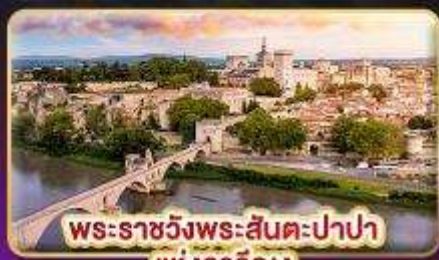
พระราชวังพระสันตะปาปา แห่งอวีญง