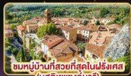
ชมหมู่บ้านที่สวยงามที่สุดในฝรั่งเศส (มูสติเยแซงก์มาร์)