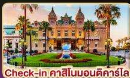
Check-in คาสสิโนมอนติคาร์โล