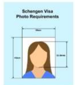
ตัวอย่างรูปถ่าย

โดยต้องเป็นรูปที่ถ่ายจากร้านถ่ายรูปเท่านั้น