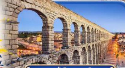
รางส่งน้ำโรมัน เซโกเวีย

สายการบินสัญชาติสเปน ✕ บินตรง Full Service