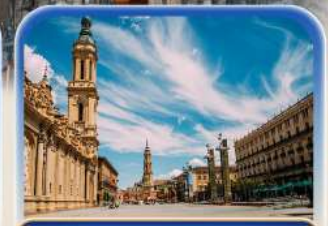
จัตุรัสพลาซ่า เดล ฟาร์