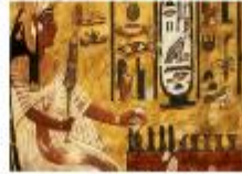
หุบผาซัคเรีย