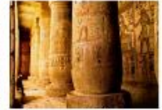
วิหารมาดินัตอาบู

** พักที่ Royal Beau Rivage Nile cruise 5* หรือเทียบเท่า **