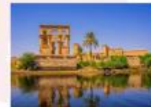
วิหารฟิเล

16.25 น. ออกเดินทางสู่กรุงไคโร สายการบิน Egypt Airlines เที่ยวบิน MS295