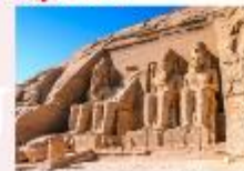
มหาวิหารอาบูซิมเบล

** พักที่ Royal Beau Rivage Nile cruise 5* หรือเทียบเท่า **