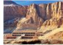
วิหารอ็คเซฟซุต