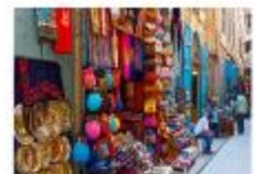
ตลาดข่านเอลคาลิลี

20.50 น. ออกเดินทางสู่อิสตันบูล เที่ยวบิน TK695