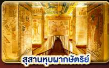
สุสานหุบผากษัตริย์