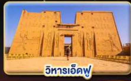
วิหารเอ็ดฟู

น้ำหนักกระเป๋า 23Kg. (เป็นระหว่างประเทศ และบินภายใน)