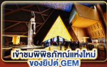
เข้าชมพิพิธภัณฑ์แห่งใหม่ ของอียิปต์ GEM