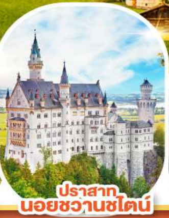
ปราสาท นอยชวานชไตน์