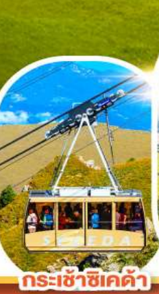
กระเช้าซีเคด้า