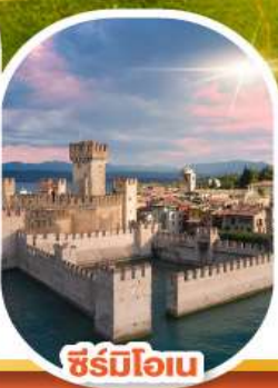
ซีร์มิโอเน