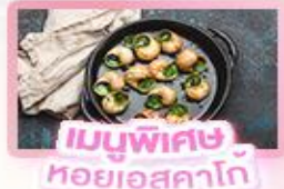
เมนูพิเศษ หอยออสตาโก้

เยอรมัน เนเธอร์แลนด์ เบลเยียม ฝรั่งเศส Keukenhof