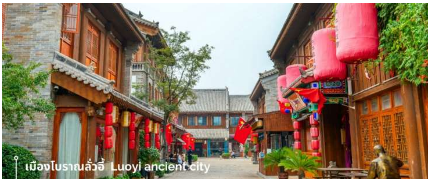
เมืองโบราณลั่วอี้ Luoyi ancient city

นำท่านเที่ยวชม เมืองโบราณลั่วอี้ เป็นสถานที่ท่องเที่ยวระดับ 1A ตั้งอยู่ในเมืองเก่าของเมืองลั่วหยาง เมืองหลวงโบราณของราชวงศ์ทั้ง 13 ราชวงศ์ บรรยากาศคอบอวลไปด้วยเสน่ห์แบบจีนโบราณ ที่ยังคงอยู่มายาวนานหลายร้อยปี เมื่อเดินเล่นผ่านเมืองโบราณลั่วอี้ จะเห็นสถาปัตยกรรมบ้านเรือน ที่มีชายคาซ้อนกันเป็นชั้นๆ และกำแพงเมือง สนามหญ้า