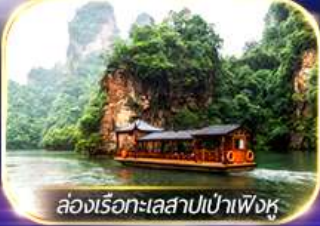
ล่องเรือทะเลสาบเป่าเฟิงหู