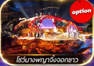
โชว์นางพญาจิ้งจอกขาว