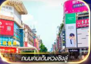
ถนนคนเดินหวงซิงสู

ล่องเรือชมเมืองโบราณ ฟุรงเจิน + ทะเลสาบเป่าเฟิงหู