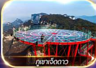
ภูเขาเจ็ดดาว