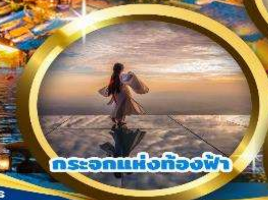
กระโจมห้องท้องฟ้า