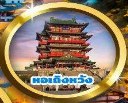
หอเกิ่งหวัง