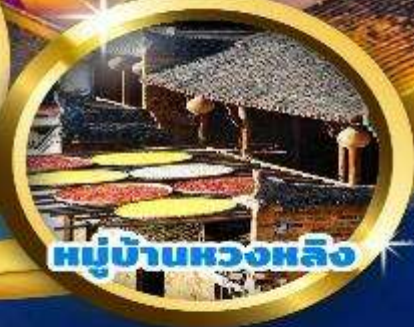
หมู่บ้านหวงหลิง