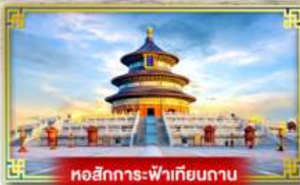
หอสักการะฟ้าเทียนถาน