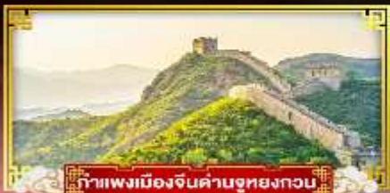
กำแพงเมืองจีนด่านซุยกวน