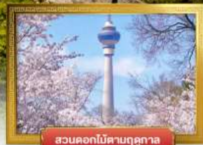
สวนดอกไม้ตามฤดูกาล