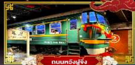
ถนนทวิงฟูจิ่ง