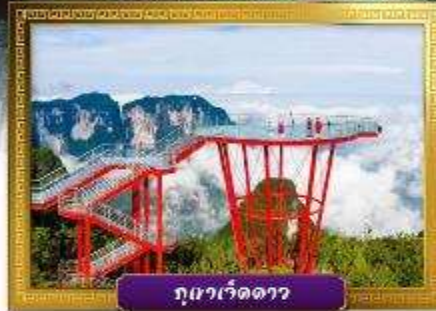
ภูเขาเจ็ดดาว