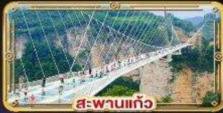
สะพานแก้ว