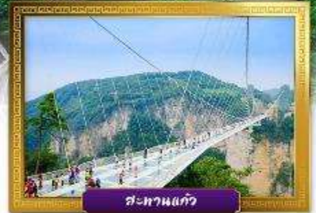
สะพานแก้ว