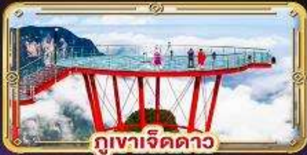
ภูเขาดาว