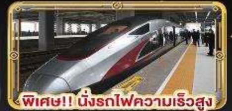
พิเศษ!! นิ่งรถไฟความเร็วสูง