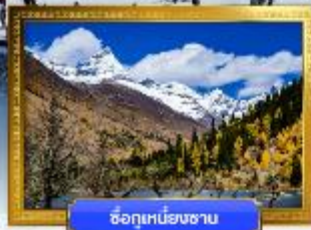
ซีอูหนิงชาน