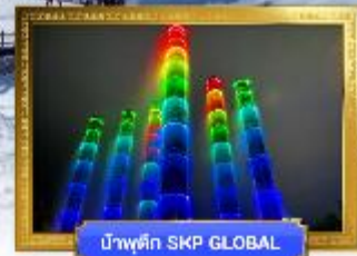
ม้าพูด SKP GLOBAL