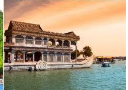
พระราชวังฤดูร้อนอ้าเหอหยวน