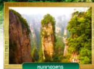
หินเงาอวดสาร