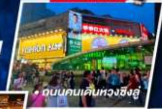
ถนนคนเดินหวงซิงฮู