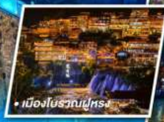
เมืองโบราณปูทรวง