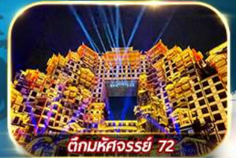
ตึกมหัศจรรย์ 72

เต็มอิ่มกับบรรยากาศเมืองโบราณเฟิ่งหวง เขาเทียนเหมินซาน ประตูล้อมรั้ว หมู่บ้านโบราณบนน้ำตกฟุหลง