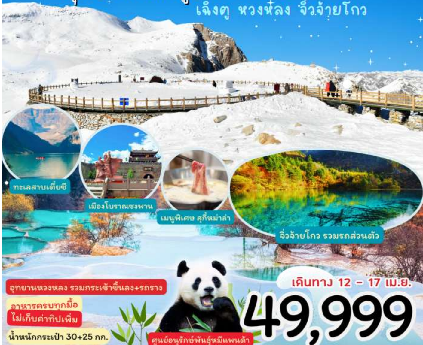
ทะเลสาบเต๋ยซี