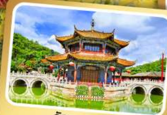
วัดหวนทอง