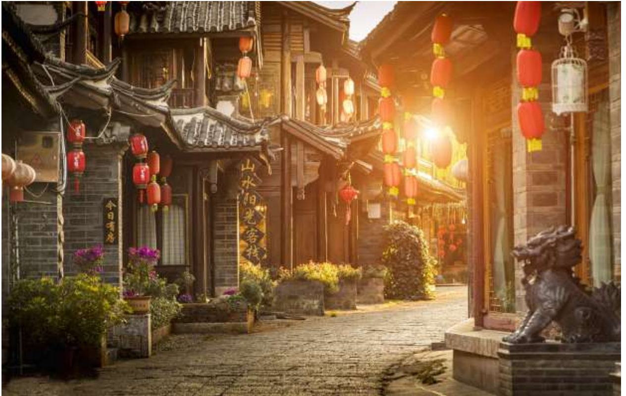
นำท่านชม เมืองโบราณลี่เจียง (Ancient Town of Lijiang) (ใช้เวลาเดินทางประมาณ 20 นาที)