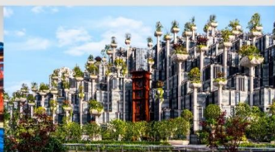
Tian An 1,000 Trees