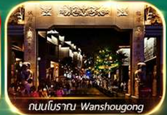
ถนนโบราณ Wanshougong

ตระการตาหุบเขาเทวดาฉีเจียงกู่ เช็กอินที่เที่ยงใหม่