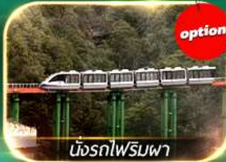
นั่งรถไฟรมพา