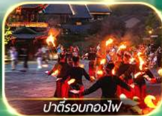
ปาตีรอกองไฟ