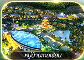
หมู่บ้านเกอเซียน