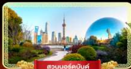
สวนนอร์คบันด์