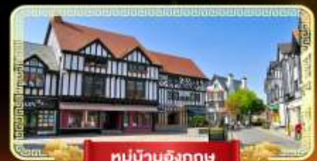
หมู่บ้านอังกฤษ