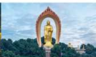
พระใหญ่ตงหลิน