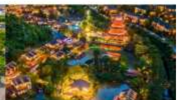
หมู่บ้านเกอเซียน

*ทางบริษัทฯ ขอสงวนสิทธิ์ในการสลับโปรแกรมทัวร์ตามความเหมาะสมขึ้นอยู่กับสถานการณ์หน้างาน โดยคำนึงถึงผลประโยชน์ของลูกค้าเป็นสำคัญ