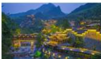
หุ่นเขาเทวดาวิ่งเซียนทู่