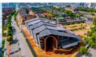
ลานวัฒนธรรมเทาซีชว่น