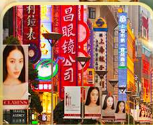
เดินเล่นถนนหนานจิง