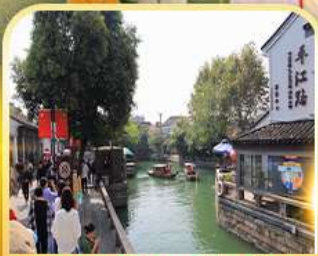
ท่องเที่ยวโบราณผิงเจียง