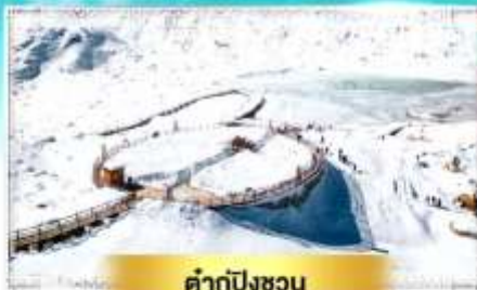
คำกู่ปิงชว