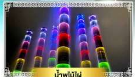
น้ำพุไม้ไฟ