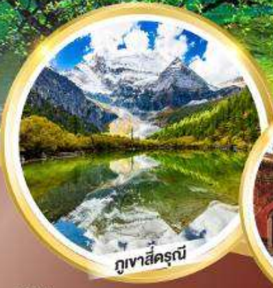
ภูเขาสีดรุณี