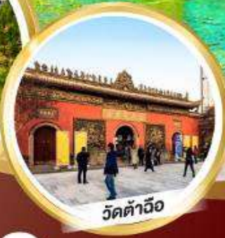
วัดต้าฉิว