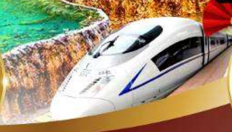
เมนูพิเศษ สุกี้หม่าล่าเสฉวน