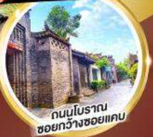
ถนนโบราณ ชอยกว้างชอยแคบ